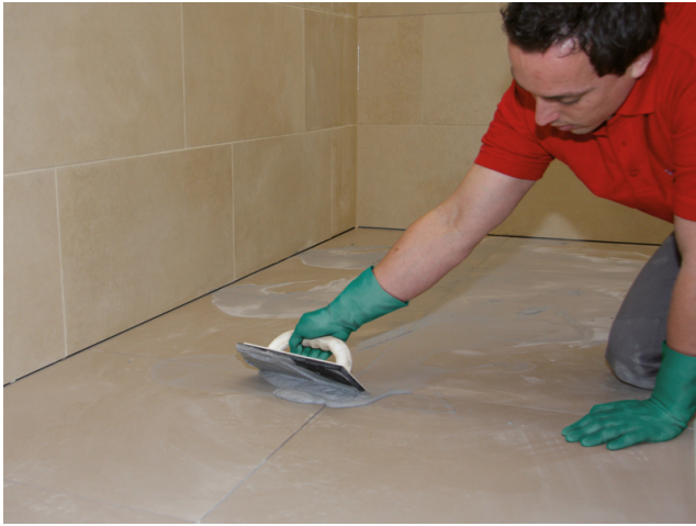
Verfugung der Fläche mit einer Sopro Fugenmasse (z.B. Sopro DF 10 DesignFuge Flex, Sopro Brillant Perlfuge)