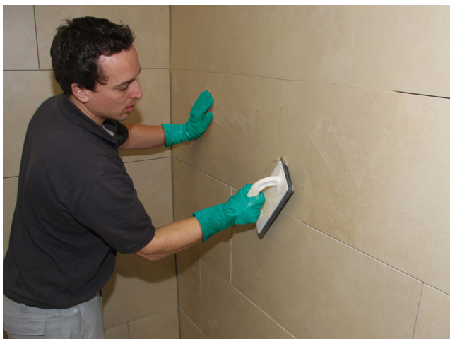
Verfugung der Fläche mit einer Sopro Fugenmasse (z.B. Sopro DF 10 DesignFuge Flex, Sopro Brillant Perlfuge)