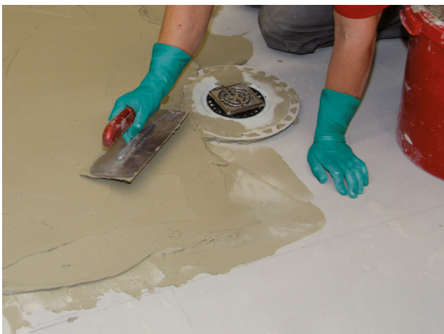
... und das Gefälle bis zu einer Spachteldicke von 10 mm für die nachfolgende Verbundabdichtung vorbereiten.