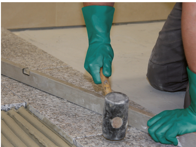
Einklopfen der Natursteinplatte und Überprüfung auf Ebenmäßigkeit.