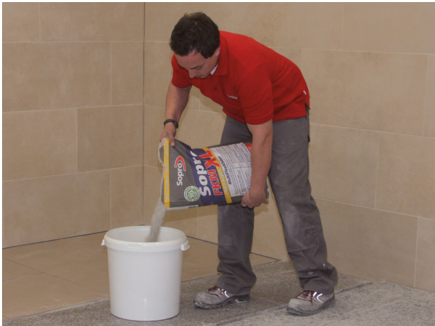
1.1 FKM XL MultiFlexKleber eXtra Light