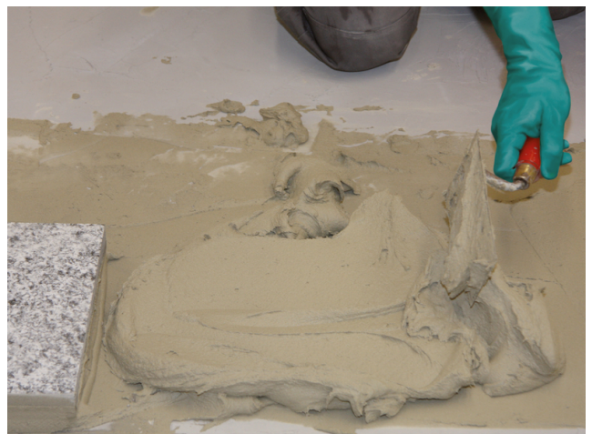
Sopro FKMXL ist für höhere Mörtelschichtstärken bis 10 mm auch mit der Kelle verarbeitbar.