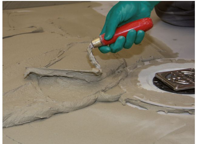
Danach Sopro FKM XL in Spachtelkonsistenz auf den Untergrund aufbringen...