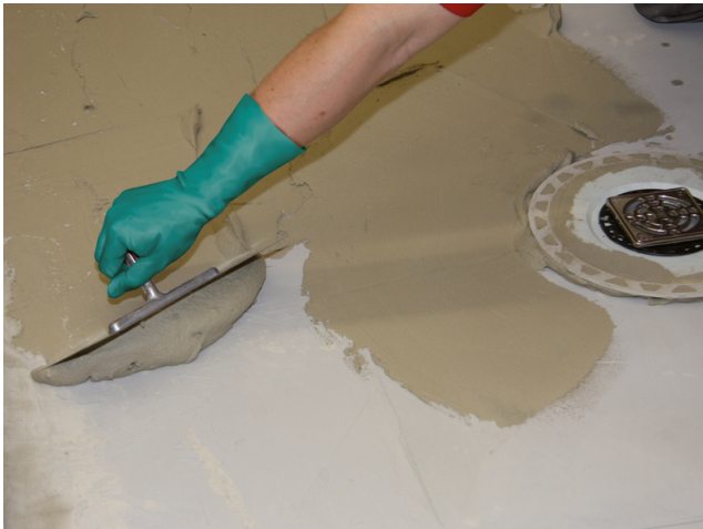
Für das Aufbringen einer partiellen Gefällespachtelung ist zuvor eine Kontaktschicht mit Sopro FKM XL aufzuziehen.