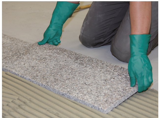
Natursteinplatte einlegen und ausrichten. Fugennetz vor der Erhärtung auskratzen.