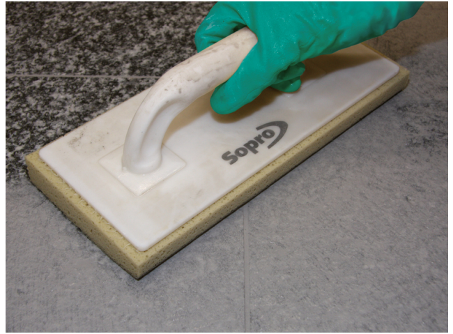
Abwaschen des Natursteinbelages nach ausreichender Standzeit der eingefugten Sopro Fugenmasse.