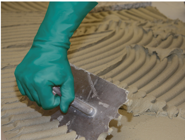
Aufziehen des Sopro FKM XL in Mittelbettkonsistenz mit einer Mittelbettkelle auf die vorbereitete Kontaktschicht.