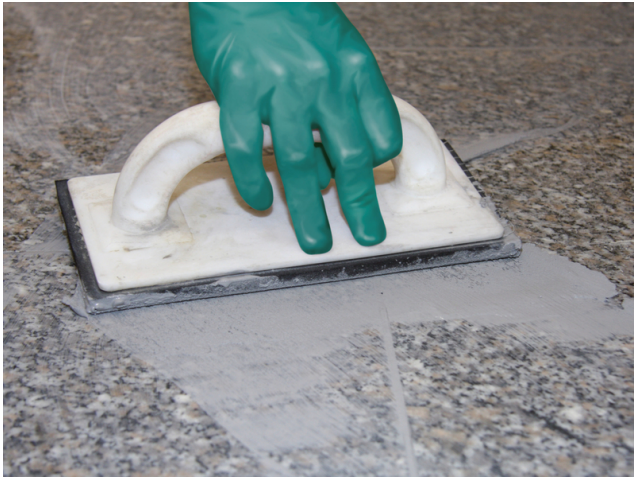
Verfugung des verlegten Natursteinbelages mit einer Sopro Fugenmasse (z.B. Sopro DF 10 DesignFuge Flex, Sopro Brillant Perlfuge).