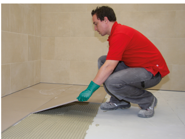
Großformatiges Feinsteinzeug einlegen und ausrichten. Fugennetz