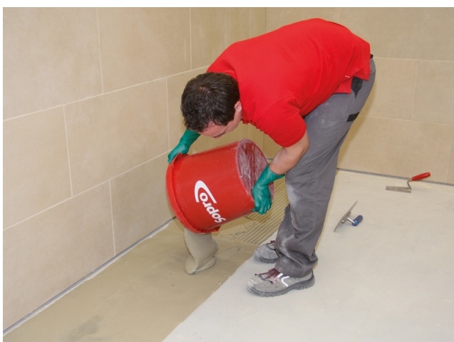
Ausgießen des FKM XL in Fließbettkonsistenz auf den vorbereiteten Untergrund.