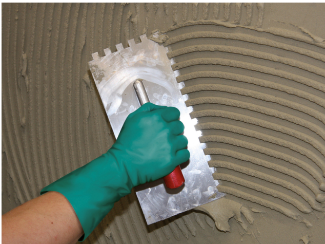
Aufziehen des Kammбетtes in Wandkonsistenz auf die vorbereitete Kontaktschicht.