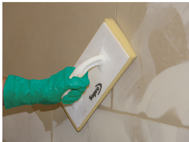
Abwaschen des Fliesenbelages nach ausreichender Standzeit der eingefugten Sopro Fugenmasse.