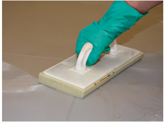
Abwaschen des Fliesenbelages nach ausreichender Standzeit der eingefugten Sopro Fugenmasse.