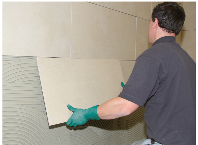
Großformatiges Feinsteinzeug einlegen und ausrichten. Fugennetz vor der Erhärtung auskratzen.