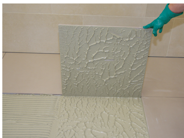
Optimale, nahezu hohlraumfreie Verlegung mit Sopro FKM XL möglich.