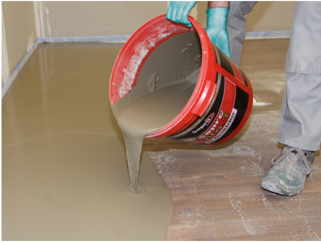
Der selbstnivellierende, faserarmierte und flexible Sopro FaserFließSpachtel wird im direkten Kontakt zum Holzdielenboden aufgebracht.